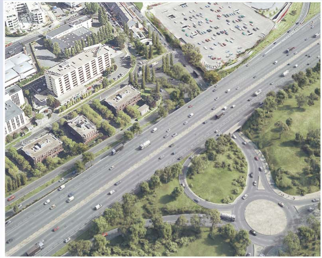
Esquisse non contractuelle de l'insertion du projet

Le projet s'accompagne d'une insertion urbaine qualitative, permettant d'intégrer l'ouvrage dans un environnement urbain dense.