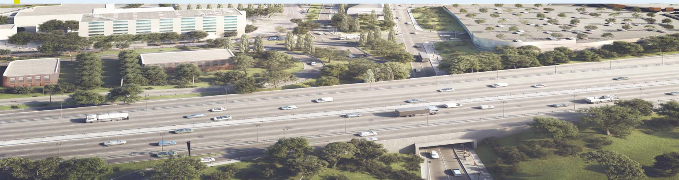
Photomontage non contractuel de l'insertion du projet

Le projet s'accompagne d'une insertion urbaine qualitative, permettant d'intégrer l'ouvrage dans un environnement urbain dense.