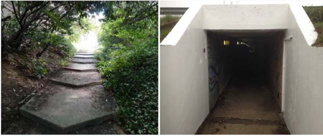
Passage souterrain existant qui sera supprimé et remplacé dans le cadre du projet