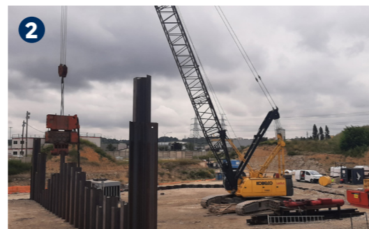
2 Avril 2021 - Battage de palplanches servant d'appuis provisoire au pont-rails et d'enceintes étanches vis-à-vis de la nappe souterraine