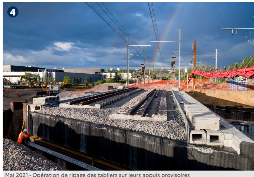
4 Mai 2021 - Opération de ripage des tabliers sur leurs appuis provisoires