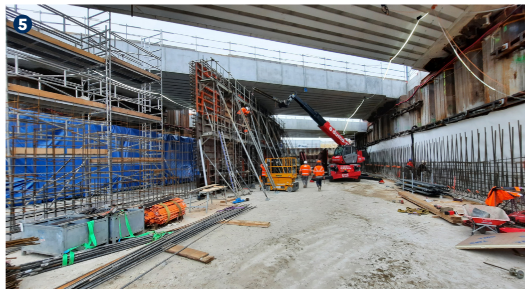
5 De juin 2021 à mai 2022 - Création des appuis définitifs sous les ponts-rails et pose des ponts-rails sur ces appuis