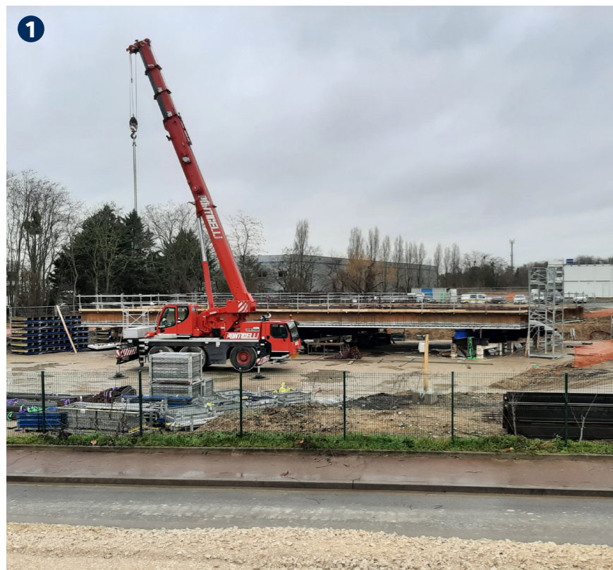
1 Fin 2020 / début 2021 - Travaux de terrassement de l'aire de préfabrication des ponts-rails, assemblage des tabliers et relevage de voies ferrées et de la rue Louis Thébault