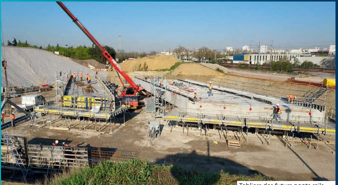
Tabliers des futurs ponts-rails